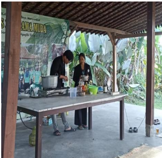
Gambar 1. Foto proses proker memasak