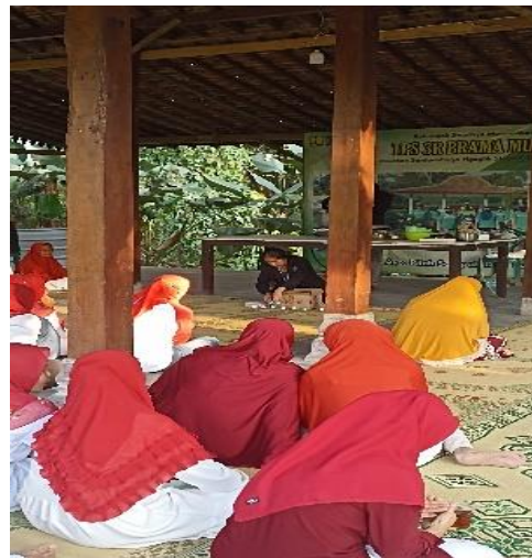
Gambar 2. Ibu – ibu PKK yang menyaksikan proker memasak